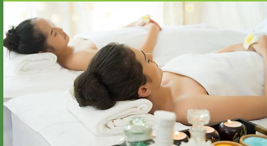
ร้านนวด / สปา