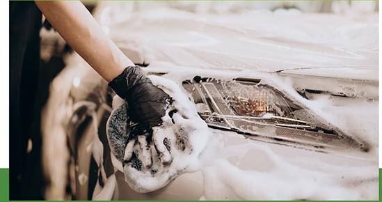
ร้านคาร์แคร์