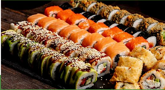
ร้านอาหารญี่ปุ่น