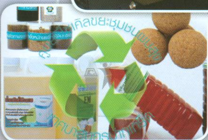
ผลิตภัณฑ์จากการทำรีไซเคิลขยะเปียก