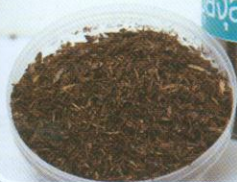
ปุ๋ยชีวภาพได้จากขยะเหลือใช้

จากศูนย์เกษตรชีวเวสต์ สระบุรีทำให้สามารถลดปัญหาของกลิ่นเหม็น จากนั้นจึงดำเนินการควบคุมไปด้วย เมื่อประสบความสำเร็จในขั้นแรก จึงได้ขยายผลสู่ภาคชุมชน โดยเริ่มแนะนำวิธีการในการคัดแยกขยะรีไซเคิล ขยะชีวภาพ และขยะที่มีพิษออกจากกัน และที่สำคัญคือการนำผลที่ได้จากกระบวนการแปรสภาพขยะคือปุ๋ยหมัก และน้ำ EM แจกจ่ายให้สมาชิกในชุมชนได้ทดลองใช้จริง รวมทั้งการผลักดันให้ศูนย์ฯ เป็นส่วนหนึ่งของชุมชน ผ่านการส่งเสริมความรู้กระบวนการขั้นตอนการดำเนินงานเมื่อเกิดผลลัพธ์ที่ดีความร่วมมือก็เพิ่มขึ้น