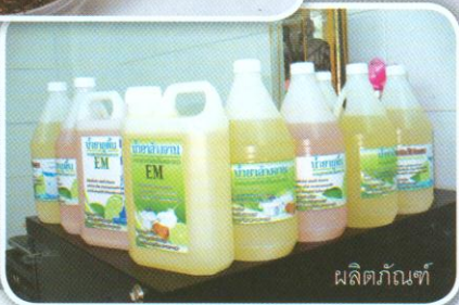
ผลิตภัณฑ์