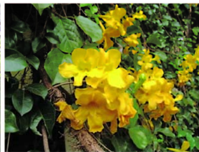
ไม้เลื้อย