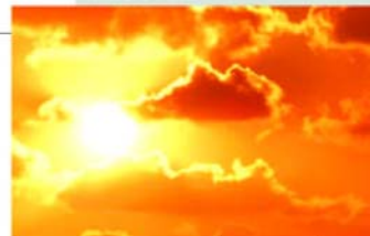
ไฟพระอาทิตย์

ธาตุทั้ง 6 ธาตุข้างต้นเป็นข้อมูลทั่วไปที่ค่อนข้างแม่นยำ อย่างไรก็ตามการคาดเคลื่อนไม่ตรงกับนิสัยได้ เนื่องจากเป็นข้อมูลที่พิจารณาจากธาตุของวันเกิด ยังไม่ได้ดูถึงความสัมพันธ์ของธาตุกับเวลา เดือน และปีที่เกิด แต่หากท่านใดต้องการรู้ให้แน่ชัดว่าตัวเองเป็นคนธาตุอะไร สามารถแจ้งข้อมูล วัน เดือน ปี เวลาเกิด เพื่อตรวจเช็คดวงของท่านได้ตามอีเมลนี้ krerkwich@baannatura.com สำหรับอีก 4 ธาตุที่เหลือ ได้แก่ ธาตุทองใหญ่ ธาตุทองเล็ก ธาตุน้ำใหญ่ และธาตุน้ำเล็ก ซึ่งจะนำมาเสนอในฉบับต่อไป คอยติดตามกัน ห้ามพลาดครับ